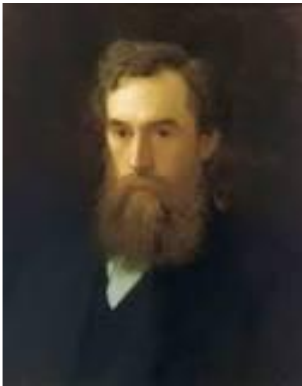
Портрет Павла Третьякова нарисован Иваном Крамской в 1883 году